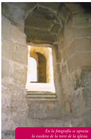
En la fotografía se aprecia la escalera de la torre de la iglesia.

Respecto a su destino como Capilla funeraria, es cierto que