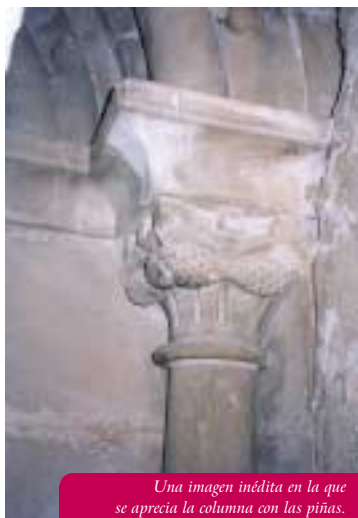
Una imagen inédita en la que se aprecia la columna con las piñas.

Incluso como caja acústica consigue transmitir unos efectos sonoros inesperados en un espacio tan ceñido.