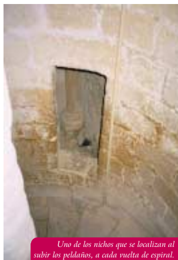
Uno de los nichos que se localizan al subir los peldaños, a cada vuelta de espiral.

Pero ¿Quién participaba en estas ceremonias? oficiadas en la capilla octogonal ¿Cuál era su finalidad? ¿Cómo se desarrollaban? Y sobre todo? ¿por qué en este templo tan especial?