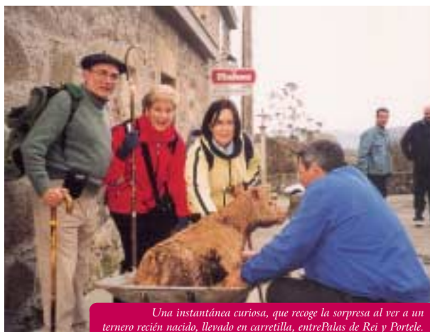
Una instantánea curiosa, que recoge la sorpresa al ver a un ternero recién nacido, llevado en carretilla, entre Palas de Rei y Portele.

Al final, la esperada llegada al Monte del Gozo y posterior bajada con el estandarte de la Asociación hasta la Catedral el Domingo de Pascua de Resurrección. Emoción, fotos y la culminación de la peregrinación. Habíamos llegado y en un día emblemático.