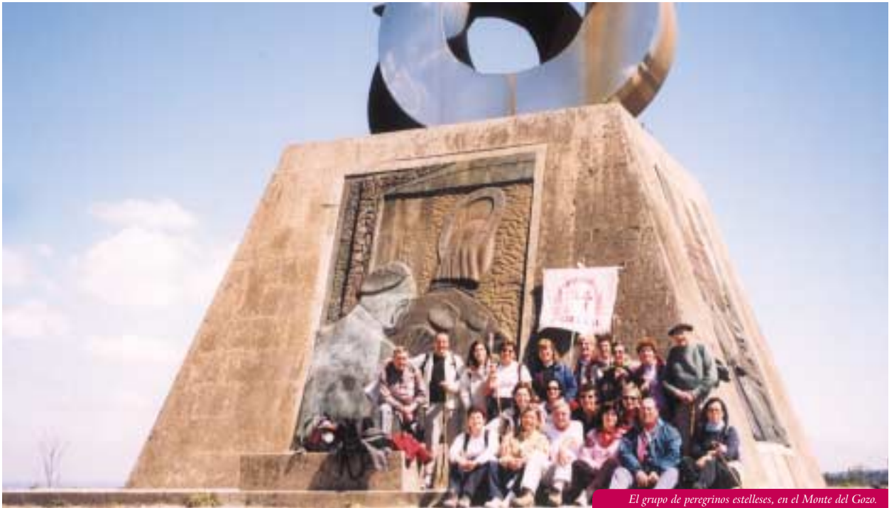
El grupo de peregrinos estellese, en el Monte del Gozo.