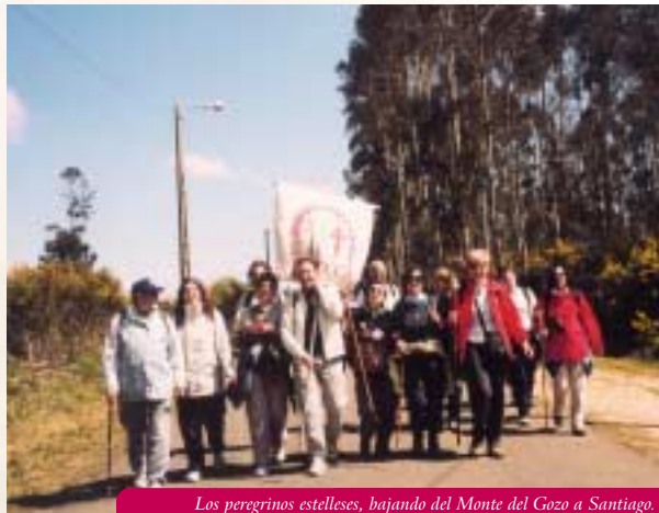
Los peregrinos estelleses, bajando del Monte del Gozo a Santiago.

Ya sabemos que este empeño es difícil y largo. De momento se ha contactado con otras Ciudades (Úbeda y Baeza) que han conseguido esta Categoría, para aprender de sus experiencias, y ver la manera de aplicarlas aquí. Hay que tener paciencia y seguir avanzando.